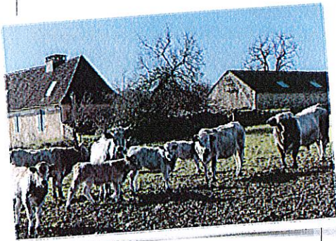
Troupeau de bovins bio de race Gascogne à Benauge.